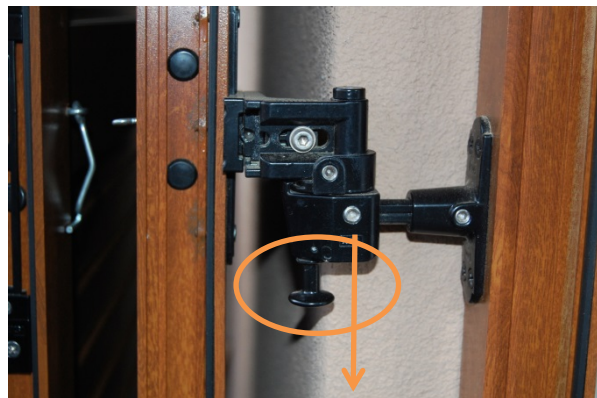
Lösen des Sicherungszapfens vor dem Schließen

Die Gelsengitter sind eine filigrane Konstruktion. In geschlossenem Zustand auf beiden Seiten unten am Rahmen möglichst gleichmäßig ein wenig nach unten drücken und dann loslassen, das Gitter geht selbstständig nach oben (so wie Rollos). Zum Schließen mit zwei Händen am Rahmen möglichst waagrecht nach unten schieben, bis der Rahmen ca. zur Hälfte im Fensterrahmen „verschwindet“, dann loslassen. Sollte das Gitter nicht fixiert sein (oder schief aussehen), bitte durch leichten Druck nach unten lösen, bis ca. zur Hälfte nach oben einrollen lassen und Vorgang wiederholen. Bitte keine Gewalt anwenden.