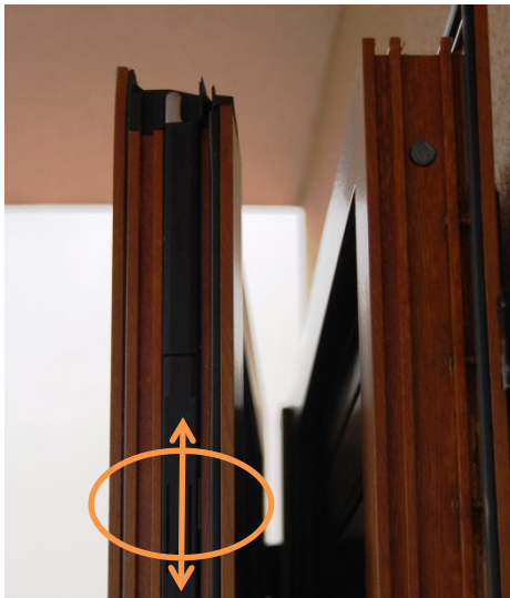
Lösen/Arretieren des Sperrzapfens